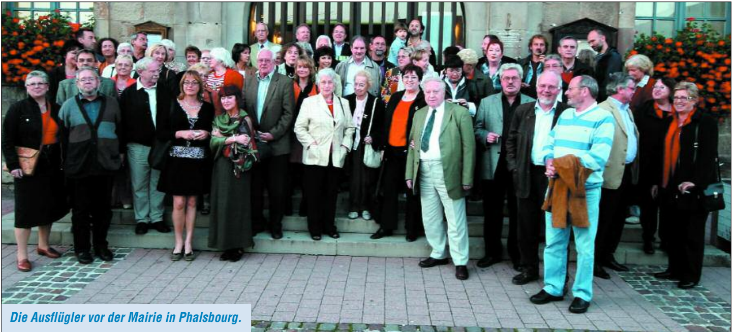
Die Ausflügler vor der Mairie in Phalsbourg.

„Rumms“ hatte es zum wiederholten Male gemacht auf dem Oberdeck des Busses, der uns von Saarbrücken über Freiburg zurück nach Saarbrücken über Obernai und Phalsbourg führen sollte. Eine eigenwillige Konstruktion, die vermeintlich genügend Platz nach oben hatte, durch die Aussparung, wo das Fenster eingelassen war. Was aber leider wieder aufgehoben wurde, durch eine Bodenwelle. Der guten Laune hat es dennoch keinen Abbruch getan. Und gegen 9 Uhr 30 wurde ein zweites Frühstück serviert. Kesselfrischer(!) Lyoner, spendiert von Pieper. Da wussten wir, alles wird gut.