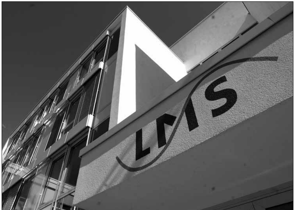
Der Sitz der Landesmedienanstalt auf den Saarterrassen.

öffentlich-Rechtlichen gelang es nicht nur, die Medienanstalten von der gerade beschlossenen Gebührenerhöhung abzukoppeln. Sie überzeugten mit dem Argument, die Ausstattung der LMS sei Aufgabe der Privaten, die