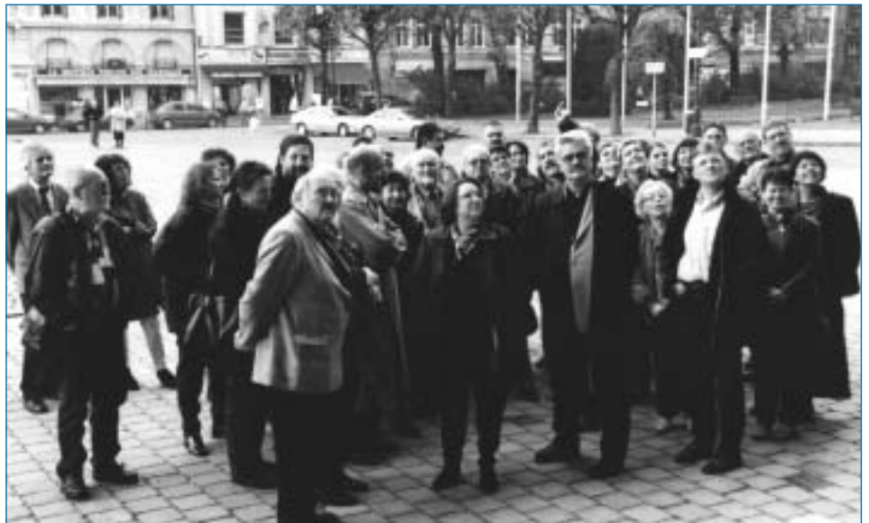
Die SJV-Ausflügler vor der Kathedrale in Reims.

Reims war die Reise wert, darin waren sich alle einig. Die ehemalige Krönungsstadt der französischen Könige auf halbem Weg zwischen Saarbrücken und Paris präsentierte