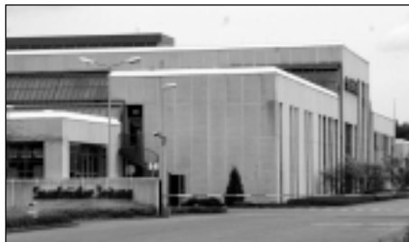
Das Druckhaus der Saarbrücker Zeitung. Nachdem die Akzidenzdruckerei in die roten Zahlen gerutscht war, kam es hier zu 111 betriebsbedingten Kündigungen.

Und über einen Mangel an Arbeit werden sich die Kolleginnen und Kollegen in der Redaktion in nächster Zeit nicht beklagen können. gf.