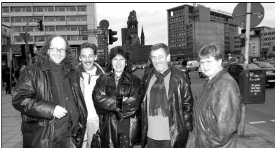
Saarländische Bildjournalisten in Berlin.

"Presse-Foto-Freiheit": 1. Bildjournalisten-Kongress in Berlin