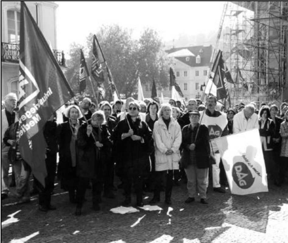
Eindrucksvolle Demonstration der SR-Beschäftigten vor der Saarbrücker Staatskanzlei.