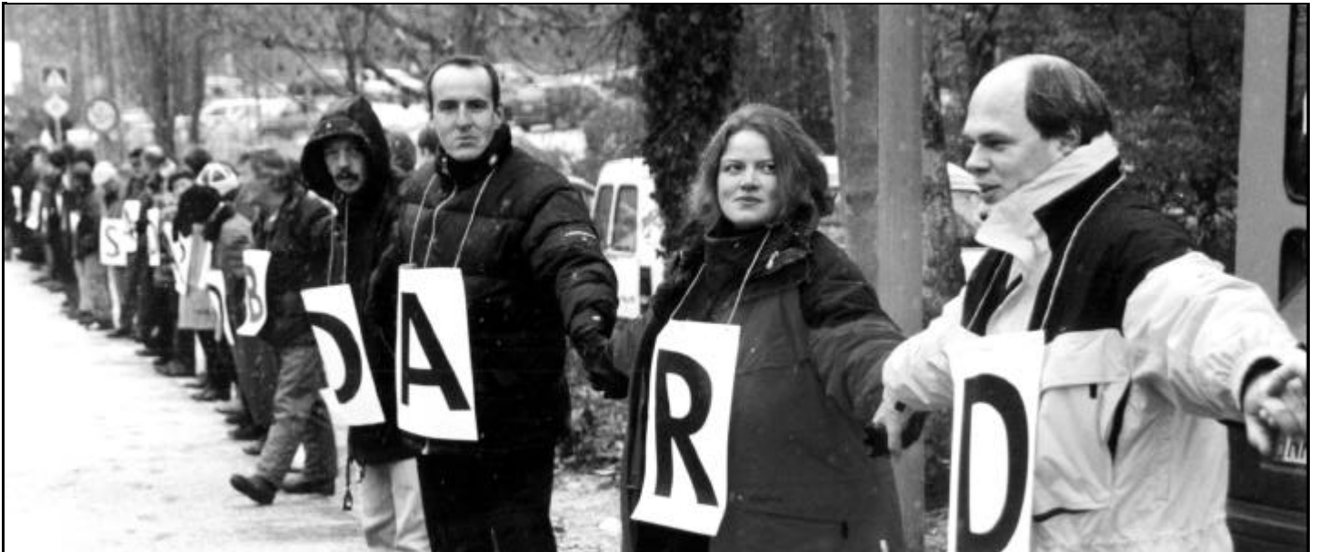
SJV-Mitglieder in vorderster Reihe: Mit zahlreichen Aktionen, wie hier auf dem Halberg, zeigten die Mitarbeiter des SR, daß sie um ihre Arbeitsplätze kämpfen.

P eter Müller, der neue Ministerpräsident, hat Wort gehalten: er hat sein Versprechen aus der Wahlkampfzeit in die Tat umgesetzt und die von Oskar Lafontaine verschärften Gegendarstellungsregelungen im Saarländischen Pressegesetz wieder kassiert. Gewiß, dazu bedurfte es keiner großen Anstrengungen - und außerdem kostet das nichts.